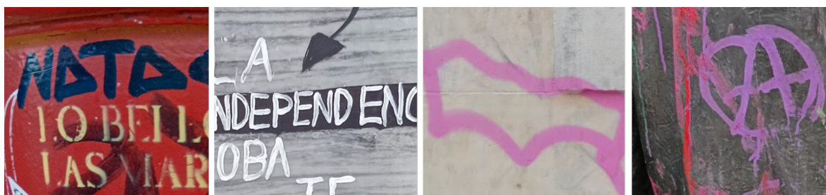
Imagen 5.- Graffiti en diferentes materiales de Bienes Muebles.

1.- Materialidad del bien mueble.- La adherencia de la pintura de grafiti está directamente relacionada con el tipo de material con el que fue elaborado el bien mueble; esto debido a que existen materiales de mayor porosidad, que permiten la penetración de la pintura, dificultando posteriormente su eliminación, siendo necesario emplear productos químicos y procesos de limpieza abrasivos, para aquellas superficies que no son pintadas o que no cuentan con un recubrimiento de fácil reposición.