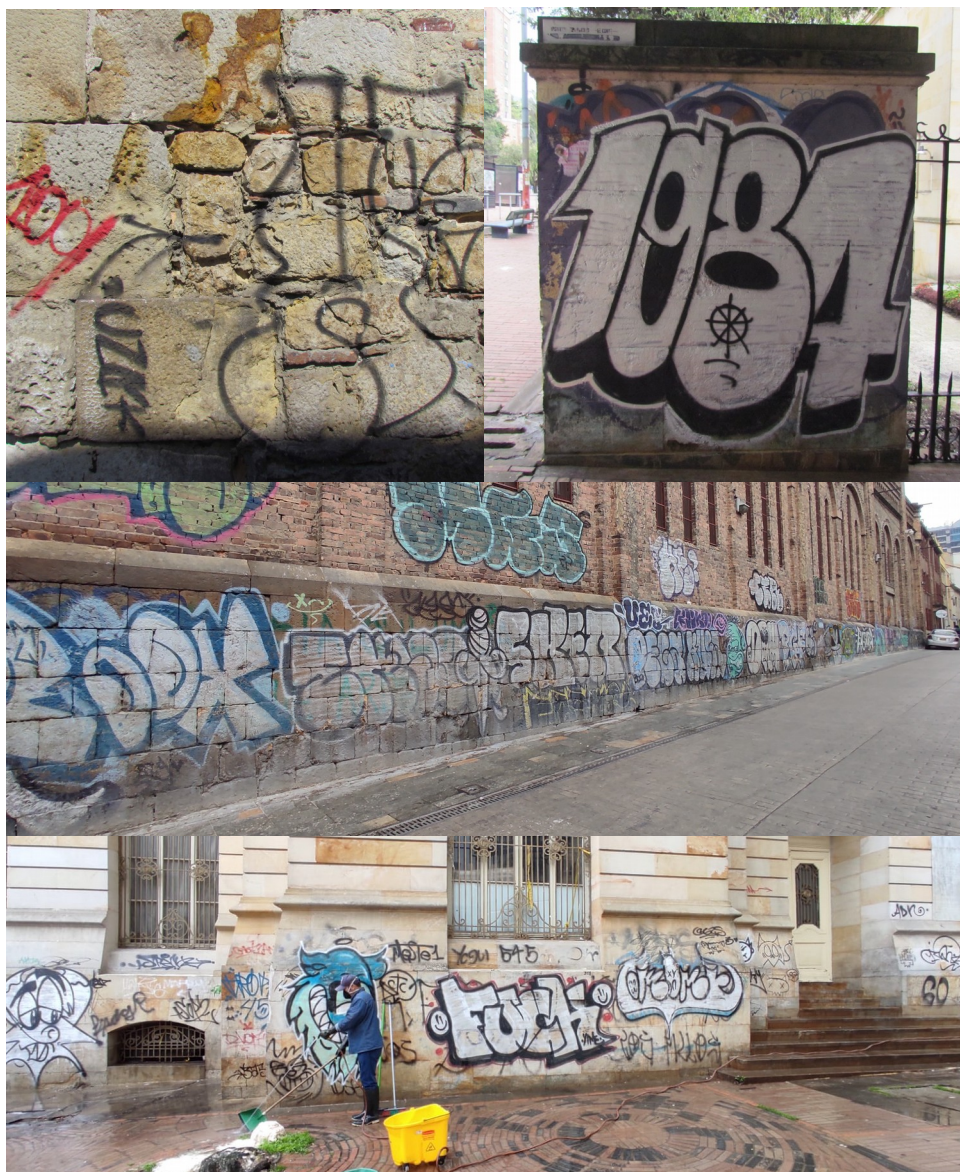
Imagen 3.- Lesiones por graffiti en fachadas patrimoniales. Equipo de Intervención en fachadas y Espacio Público.

elementos afectados, lo que implica procesos cada vez más especializados y costosos para su intervención. Por otro lado, debido a esta lesión y los recurrentes procesos de limpieza, se pueden llegar a causar pérdidas parciales o totales del material, alterando los valores estéticos, simbólicos e históricos que hacen parte de la composición formal de los inmuebles.