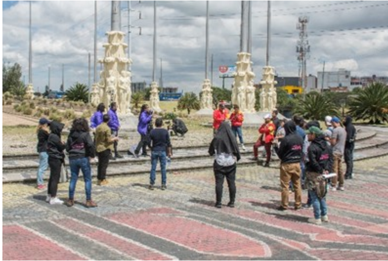
Imagen 1.- Análisis del Caso y Recorrido al Monumento.

En el recorrido al Monumento a las Banderas, los participantes pudieron identificar las tensiones generadas por las intervenciones de grafiti en este Bien de Interés Cultural, lo que dio lugar a una reflexión colectiva sobre cómo gestionar de manera sostenible la relación entre el arte en el espacio público y la conservación del patrimonio.