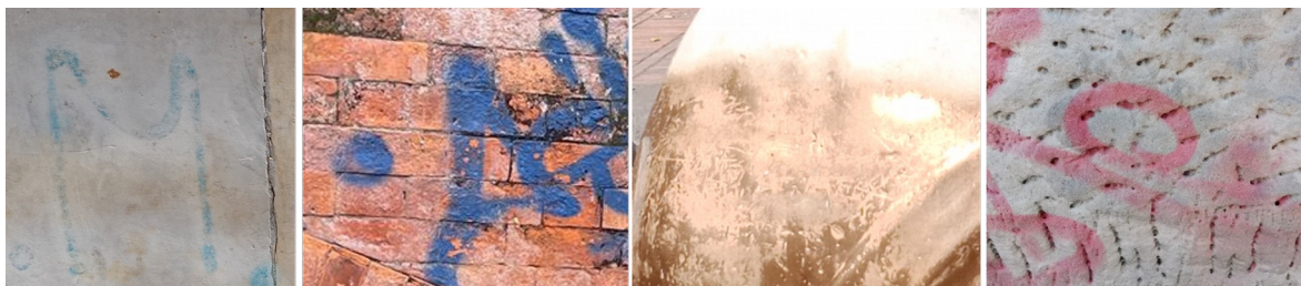
Imagen 7.- Graffiti sobre superficies con procesos de deterioro en la superficie

entre otras, su posterior eliminación requerirá de procesos especializados que en menor o mayor medida, de acuerdo con el avance del deterioro, generarán pérdida de material constitutivo del bien mueble.