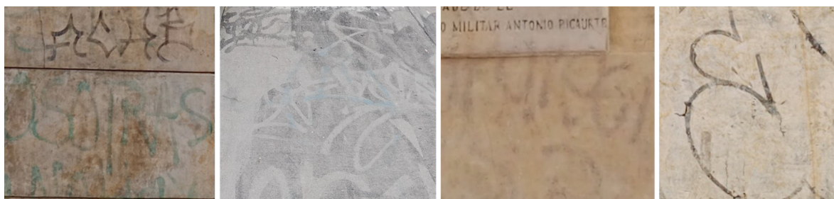
Imagen 6.- Rastros y manchas de grafiti después de intervención.

En algunos casos, la porosidad del material que permite la penetración y adherencia de la pintura, hace imposible eliminar la totalidad del grafiti, quedando de esta manera rastros y manchas del grafiti.