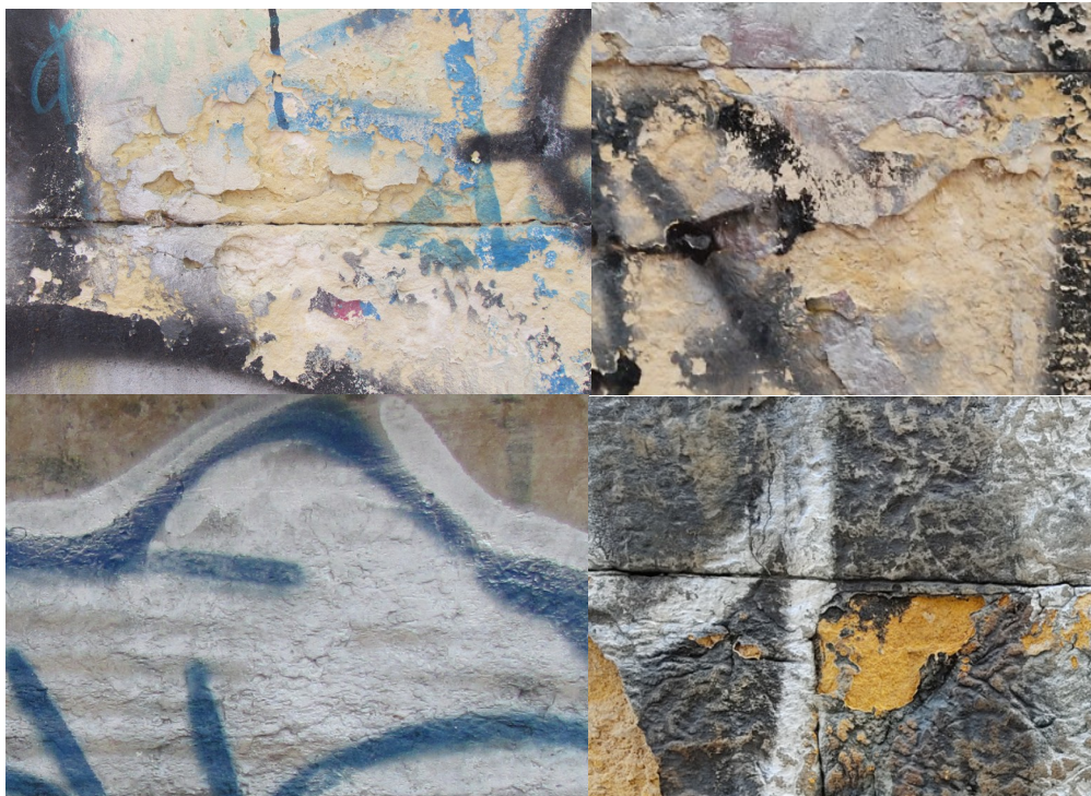
Imagen 4.- Afectaciones de la materialidad por procesos de intervención. Equipo de Intervención en fachadas y Espacio Público. Fuente: IDPC 2025

Asimismo, los sectores patrimoniales en los cuales se presentan estos tipos de lesiones, conllevan una percepción de inseguridad para los peatones y quienes habitan en el lugar, dado que muchas veces es tal el impacto de las afectaciones que la lectura general del perfil urbano y las características de los inmuebles patrimoniales, se ve alterada.